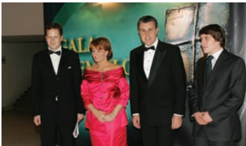
Familia Regală la Gala UNITER